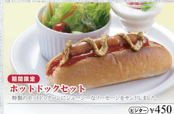
期間限定 ホットドッグセット