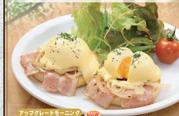
アップグレードモーニング New

アップグレードモーニングと致しまして特別価格にて、「エッグベネディクト」に変更できます。